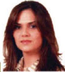
Roaya Ali Salman Business Group رؤيا علي سلمان مجموعة الأعمال