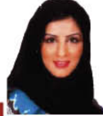
Amal Al Saad Mortgage Loan أمل السعد القروض العقارية