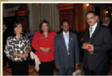
EB Backs National Campaign P.5