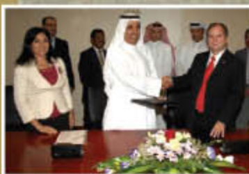
EB signs MOU with CMHC P.5