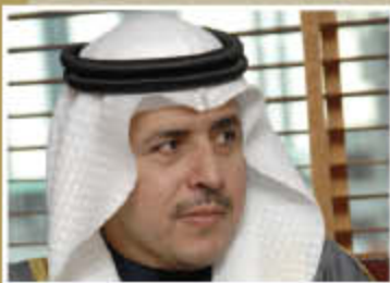
EB Thanks Minister P.3