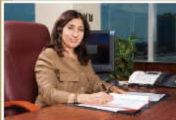
EB Projects Spotlighted P.4